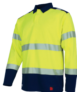
Jaune Fluo/Marine 96