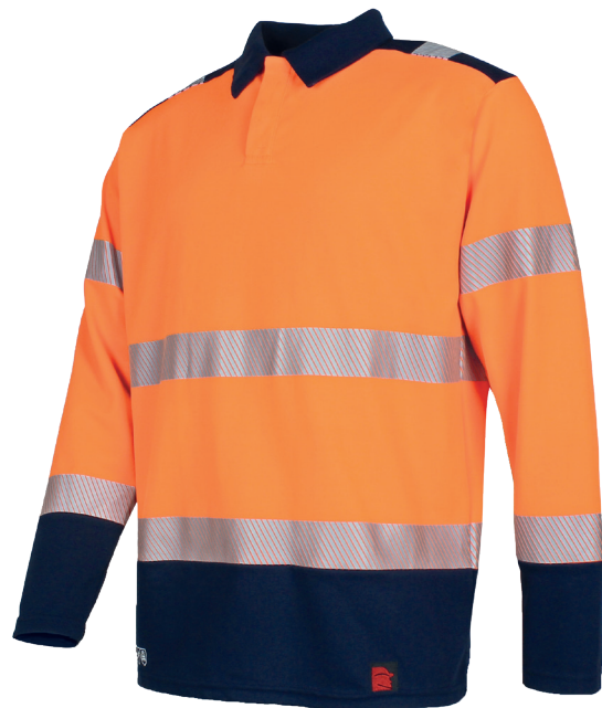
Orange Fluo/Marine 100